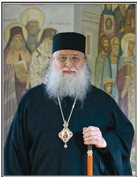
ТРИАДИЦКИЙ ЕПИСКОП ФОТИЙ